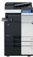
bizhub mit Original-Einzug & Heftfinisher