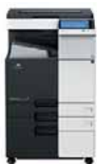
bizhub mit Ablage & Untertisch