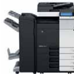
bizhub mit Broschüren-Finisher & Papierkassetten