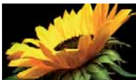
Polymerisationstoner Simitri® HD

Der Simitri® HD Toner bietet eine höhere UV-Lichtbeständigkeit als herkömmlicher Offsetdruck.