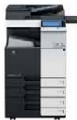
bizhub mit Originaleinzug & Papierkassetten