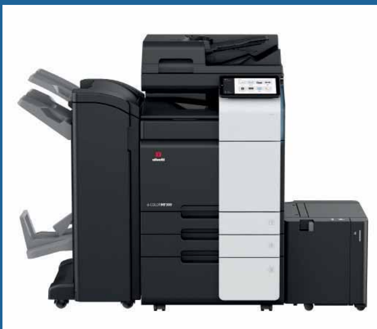
d-Color MF309 mit DF-714+PC-416+LU-302+RU-513+FS-536SD