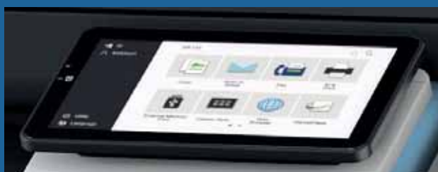
Neues 10,1-Zoll Bedienfeld mit Vibrationsfeedback für einfache und intuitive Bedienung